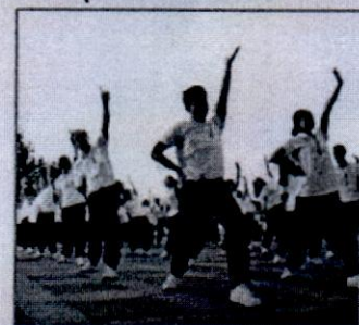
ชุดออกกำลังกาย