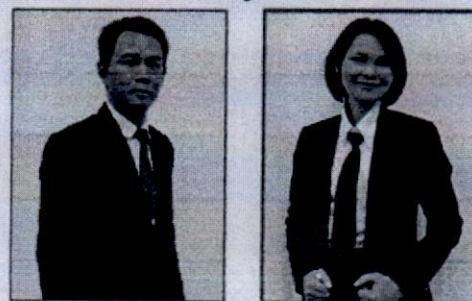
เครื่องแบบ/ชุดระหว่างฝึกอบรม