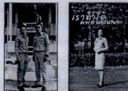
ชุดเครื่องแบบข้าราชการสีกาก็แขนยาว