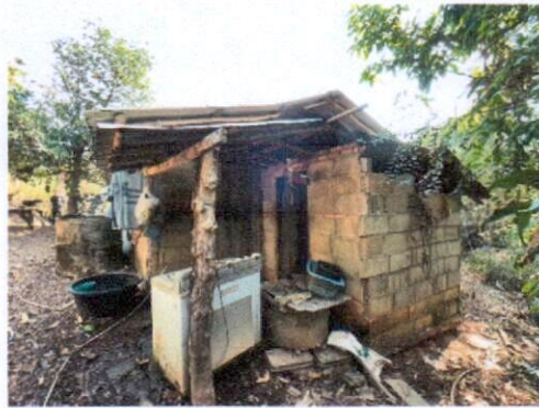
สภาพส้วม