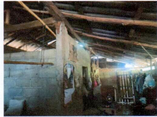
สภาพภายในบ้าน หลังคารั่วผุพัง โครงสร้างหลังคาไม่แข็งแรง ประตูไม่แข็งแรง