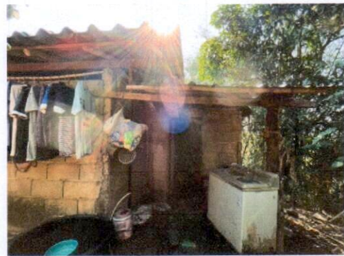
สภาพหลังบ้าน