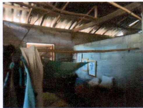
สภาพห้องนอน ไม่มีมุ้ง