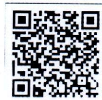
ดาวน์โหลดเอกสารที่เกี่ยวข้อง

ผู้อำนวยการกลุ่มงานเลขานุการคณะกรรมการส่งเสริมคุณธรรมแห่งชาติ