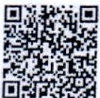
QR Code ใบสมัคร