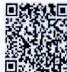
QR-Code ประกาศรับสมัคร