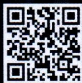
แบบฟอร์มใบสมัคร