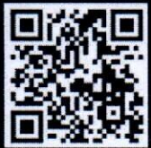
รายละเอียดข้อมูลเพิ่มเติม

ส่งผลงานทาง e-mail : vijai2567@gmail.com