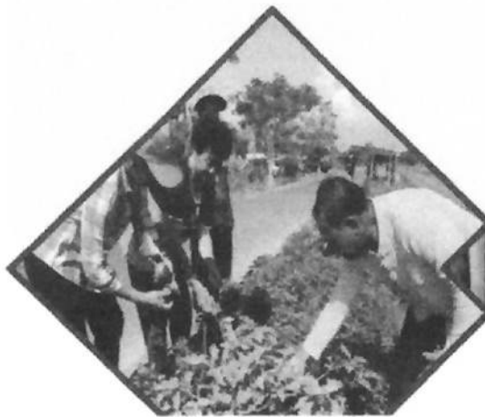
สร้างความมั่นคง